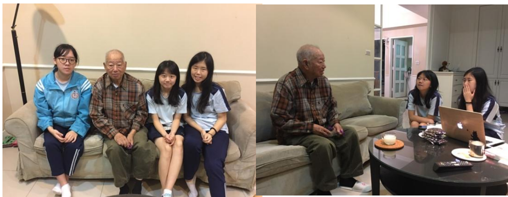
圖三、圖四：訪問照片