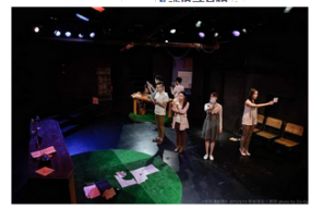
▲《彼得潘遊戲》劇照。(圖/A劇團提供，下同)

ETtoday > 生活 > 藝文 2015年05月23日 19:44 生活 生活焦點 校園 氣象 健康 藝文 運勢 占卜 又唱又演又玩密室逃脫 阿卡貝拉原來可以那麼好玩！ 正文 網友評論 友誼列印