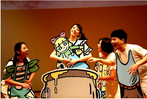
阿卡的兒歌大冒險 (2015-17, 台北兒藝節)