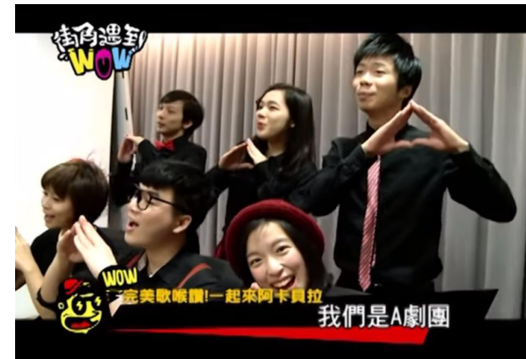
▲三立電視台《街角遇到WOW》