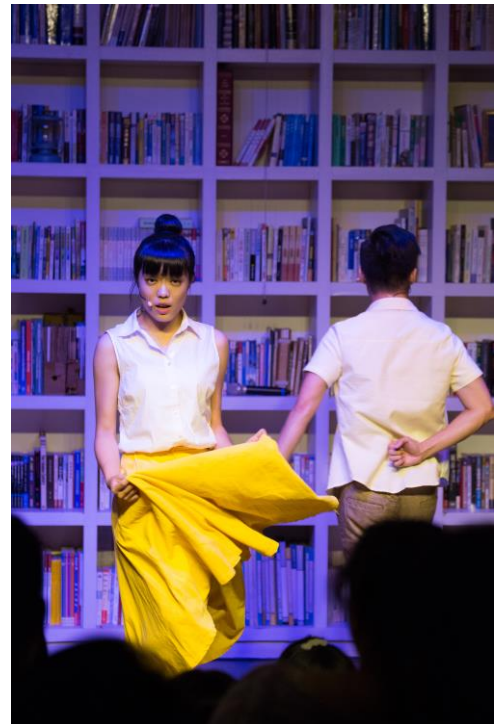
《歌劇簡介》—音樂劇之前身

全劇音樂皆使用時下最流行的阿卡貝拉編曲，由十一位歌手演唱眾多國內外著名音樂劇歌曲。小學到高中音樂課中不曾欣賞過的歌曲，一次唱給你聽！