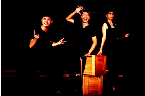
吉米不難搞 (2017, 第十屆藝穗節類別首獎)