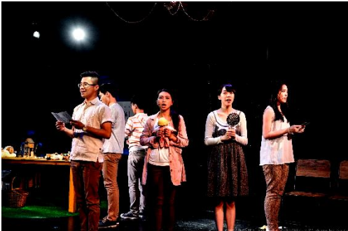
彼得潘遊戲 (2015, 第八屆藝穗節類別首獎)