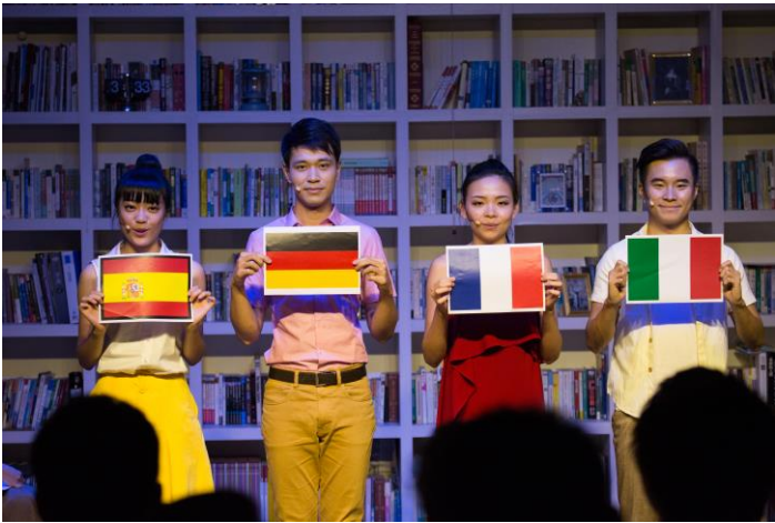
《Let it go 各語言版本》-- 語言對音樂劇之影響