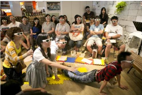
阿茲大地 (2013, 第六屆藝穗節佳作)